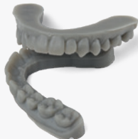
9 min 11 Aligner-Modelle