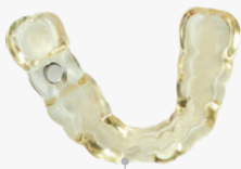
48 min 8 Bohrschablonen

Bislang unerreichte Druckgeschwindigkeiten. Drucken Sie alle 49 Sekunden ein Modell.