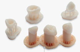
18 min mehr als 100 Kronen

Vereinfachte Zahnmedizin durch innovative Lösungen.