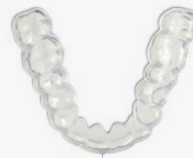
49 min 8 Schienen